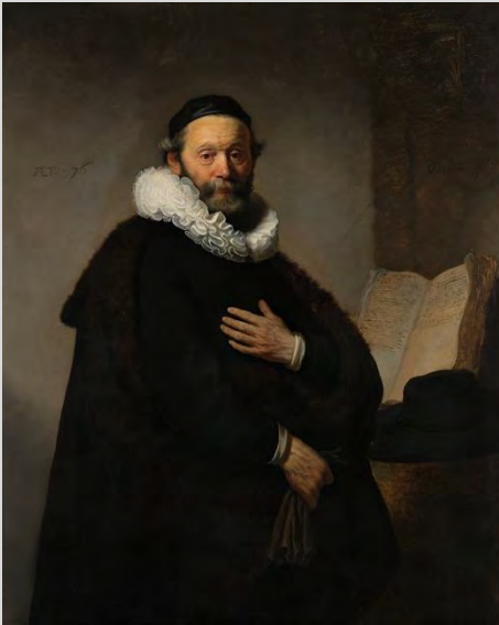
Portret van Johannes Wtenbogaert, 1633, olieverf op doek, Rijksmuseum Amsterdam