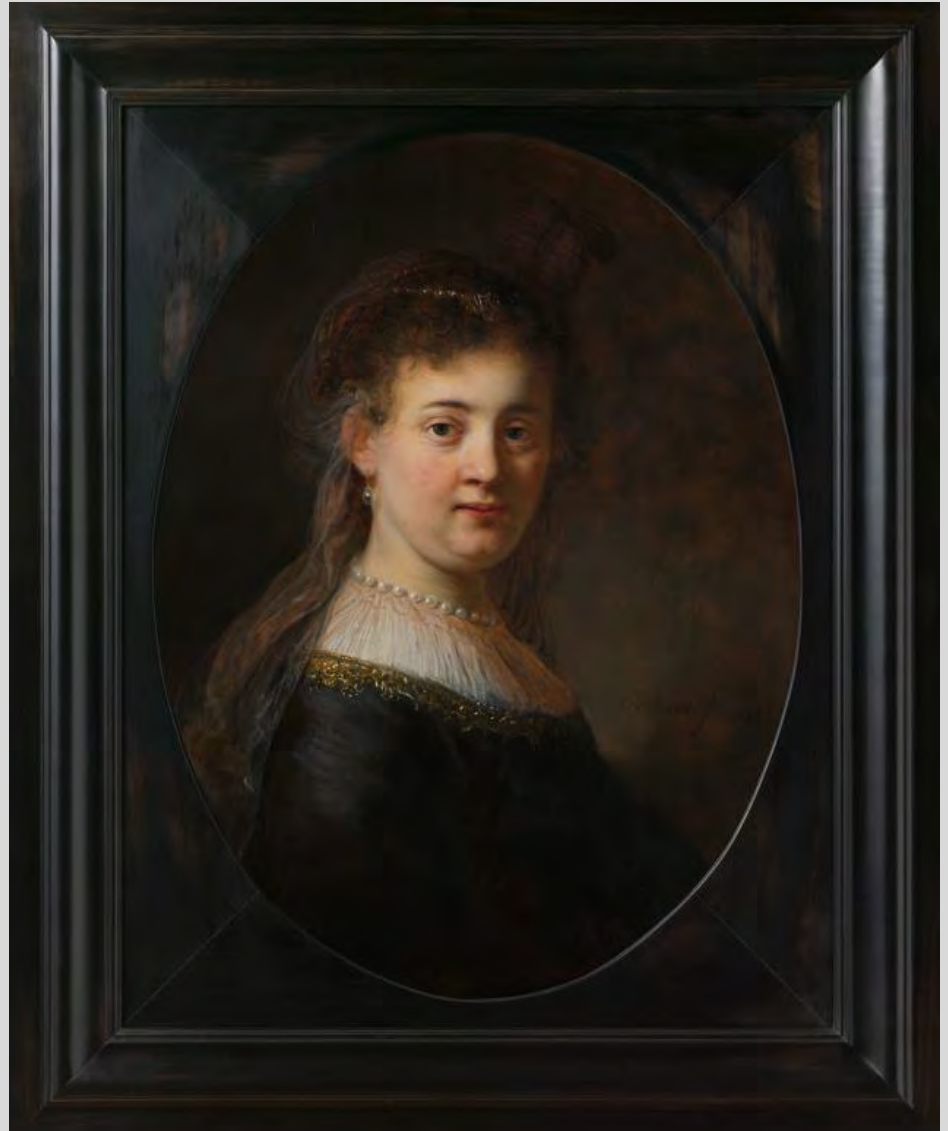
Jonge vrouw in gefantaseerde kleding, 1633, olieverf op paneel, Rijksmuseum Amsterdam.