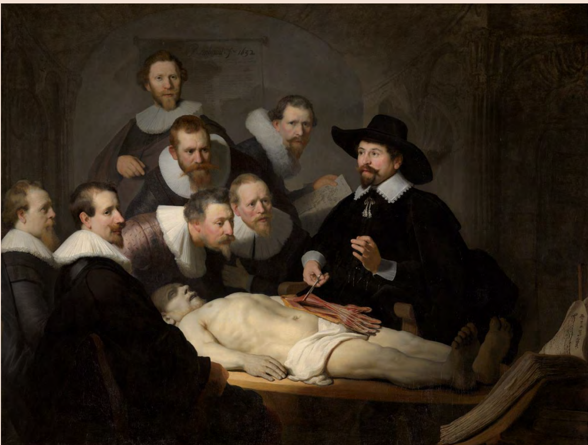
De anatomische les van DR Nicolaes Tulp, 1632, olieverf op doek, Mauritshuis