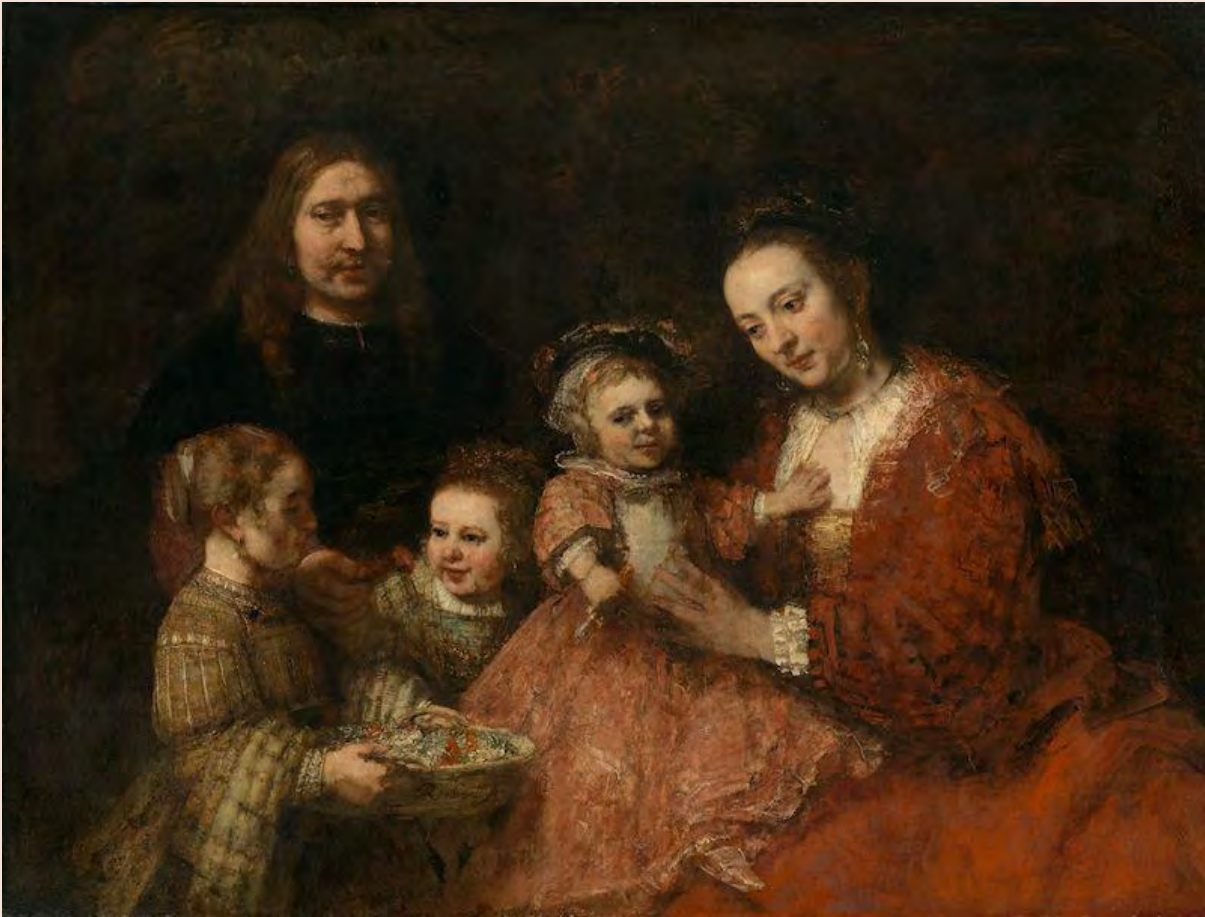
Familieportret, ca. 1665-68, olieverf op doek, Herzog Anton Ulrich-Museum, Braunschweig