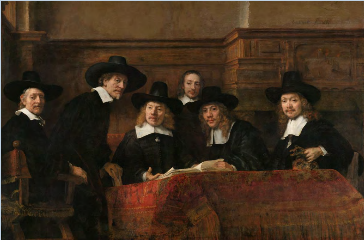
De Staalmeesters, 1662, olieverf op doek, Rijksmuseum.