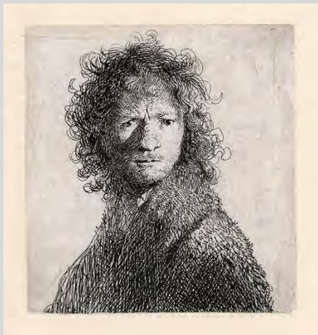
Zelfportret fronsend, ets, 1630, Museum Het Rembrandthuis.