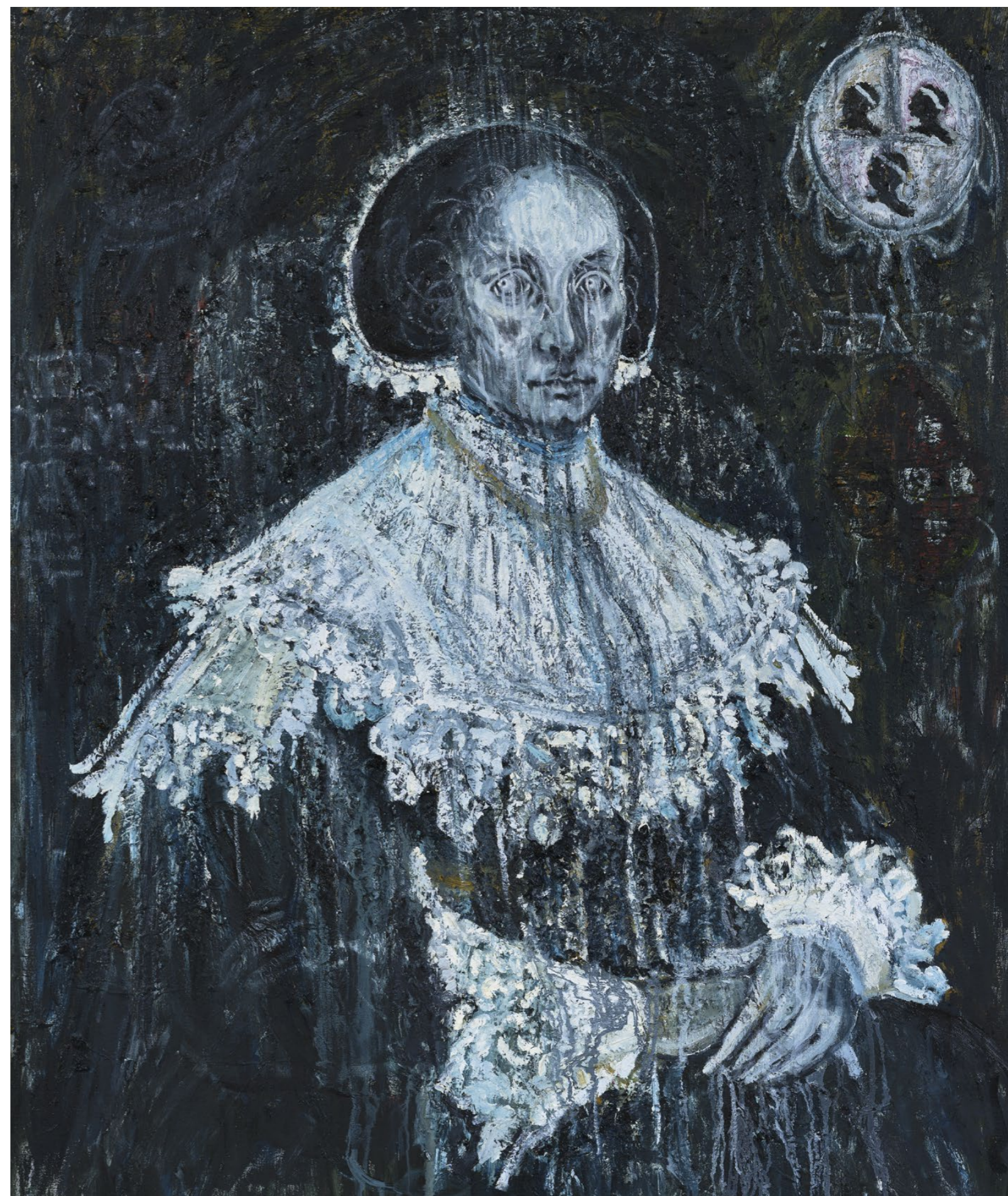
HET SCHILDERIJ CLARA ABBA VAN NATASJA KENS MIL.

Sinds eind 2019 is de Governance-structuur van de Stichting Collectie Het Rembrandthuis gemoderniseerd. De collectie Rembrandtetsen en etsplaten van de stichting Museum Het Rembrandthuis is al lange tijd ondergebracht bij deze Stichting Collectie Het Rembrandthuis. In 2019 zijn de statuten van de stichting op punten gewijzigd en is er een nieuw bestuur aangetreden. De stichting heeft tot doel het verkrijgen, beheren en (doen) exposeren van de (beeldende) kunstcollectie van het museum, alsmede het uitbreiden van deze collectie. In 2020 is de eerste jaarrekening van de Stichting Collectie Het Rembrandthuis opgesteld. De stichtingen zijn aan elkaar gelieerd en Stichting Museum Het Rembrandthuis financiert de minimale administratiekosten voor Stichting Collectie Het Rembrandthuis.