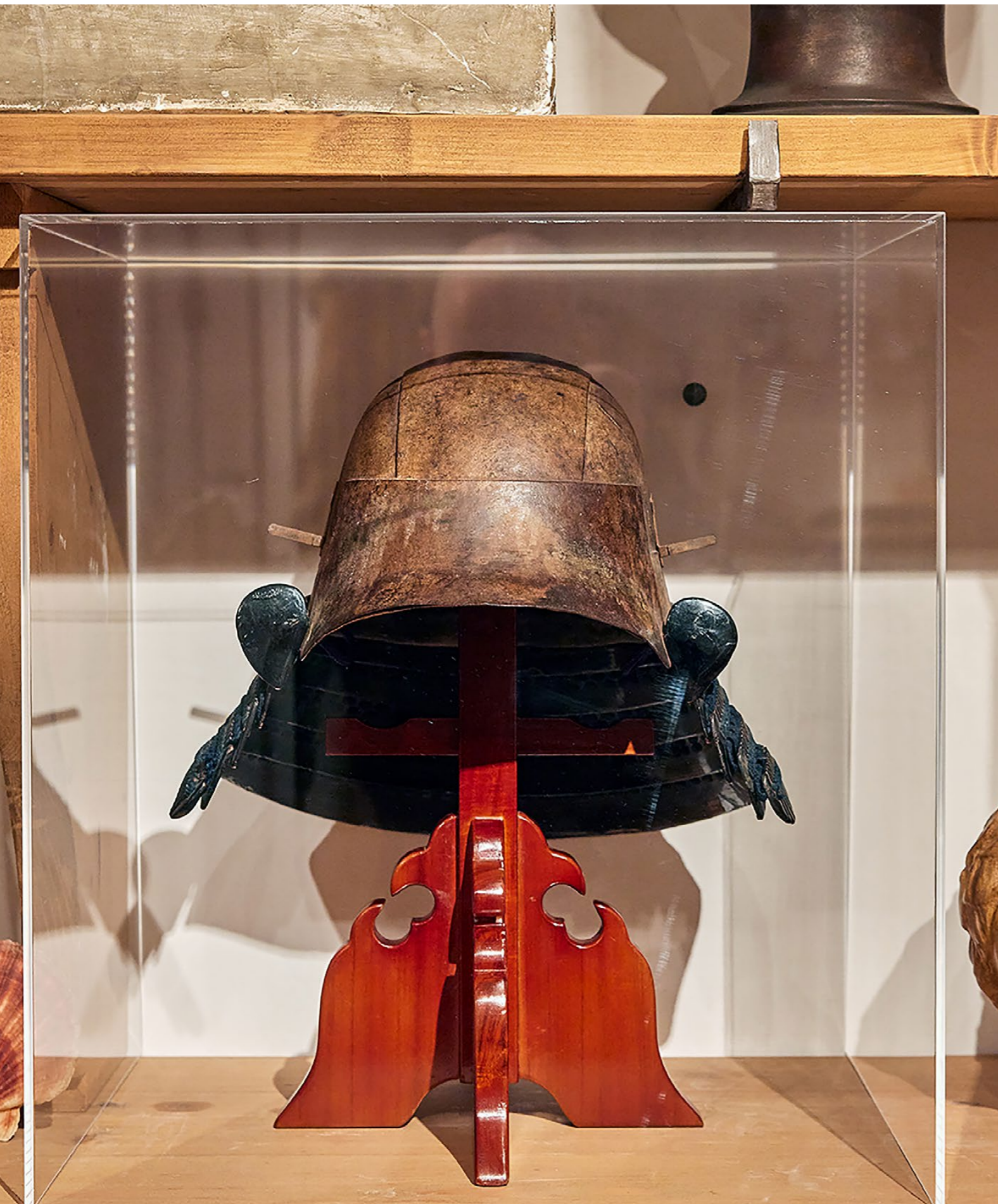
NIEUWE AANWINST: EEN 17DE-EEUWSE JAPANESE HELM.

bij een particuliere verzamelaar een vroeg zeventiende-eeuws exemplaar op het spoor, dat we konden aankopen. De helm is sindsdien permanent te zien in de kunstcaemer en daarmee is Rembrandts interesse in Japanse objecten eindelijk zichtbaar geworden in zijn huis.