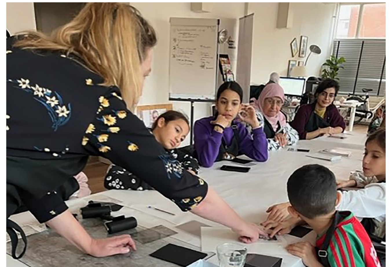
WORKSHOP MET BUURTMOEDERS MOEDERKRACHT

Het OF/ BY/ FOR ALL veranderprogramma is één van de instrumenten waarmee we onszelf leren duurzame relaties op te bouwen met gemeenschappen om ons heen. Het afgelopen jaar heeft Museum Rembrandthuis zich gericht op de volgende focusgroep: 'Ouders/verzorgers uit Amsterdam Nieuw-West met kinderen in de basisschoolleeftijd die zich verbonden voelen met de Arabische cultuur en die