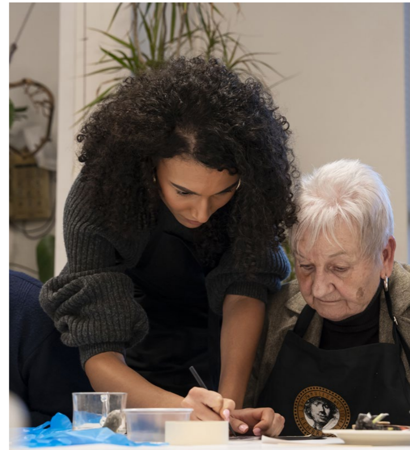
WORKSHOP MET MISS NEDERLAND IN DE KLINKER

Het jaar werd afgesloten met het leegmaken van het museum en het veiligstellen van de collectie. Na de sluiting van het museum is de collectie op locatie gefotografeerd, gecontroleerd en geregistreerd, zodat het na de heropening allemaal op de juiste plek kon worden teruggehangen. Daarna is de hele collectie verpakt, verplaatst en veilig opgeslagen. Dit is gedaan in samenwerking met restaurator Oleg Karuvits, HIZKIA Amsterdam en Helicon Conservation Support B.V..