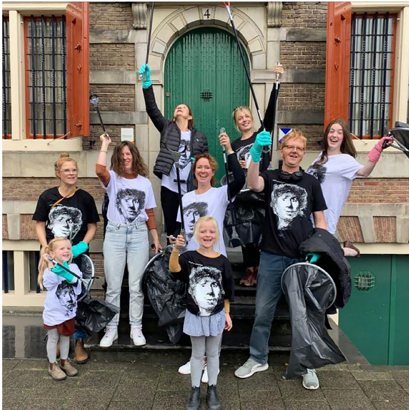
WORLD CLEANUP DAY

men wou meer weten over Saskia, Rembrandts buurt en wie Rembrandt naast zijn kunstenaarschap was. De tweede groep panelleden bestond uit podcastmakers, verhalenvertellers, een dramaturg en een regisseur. Met hen keken we vooral naar de flow van het verhaal, de personages en de boodschap. Tot slot zijn we nog een keer samengekomen met beide panelgroepen om het eindresultaat te beluisteren. Iedereen was heel tevreden met het eindresultaat.