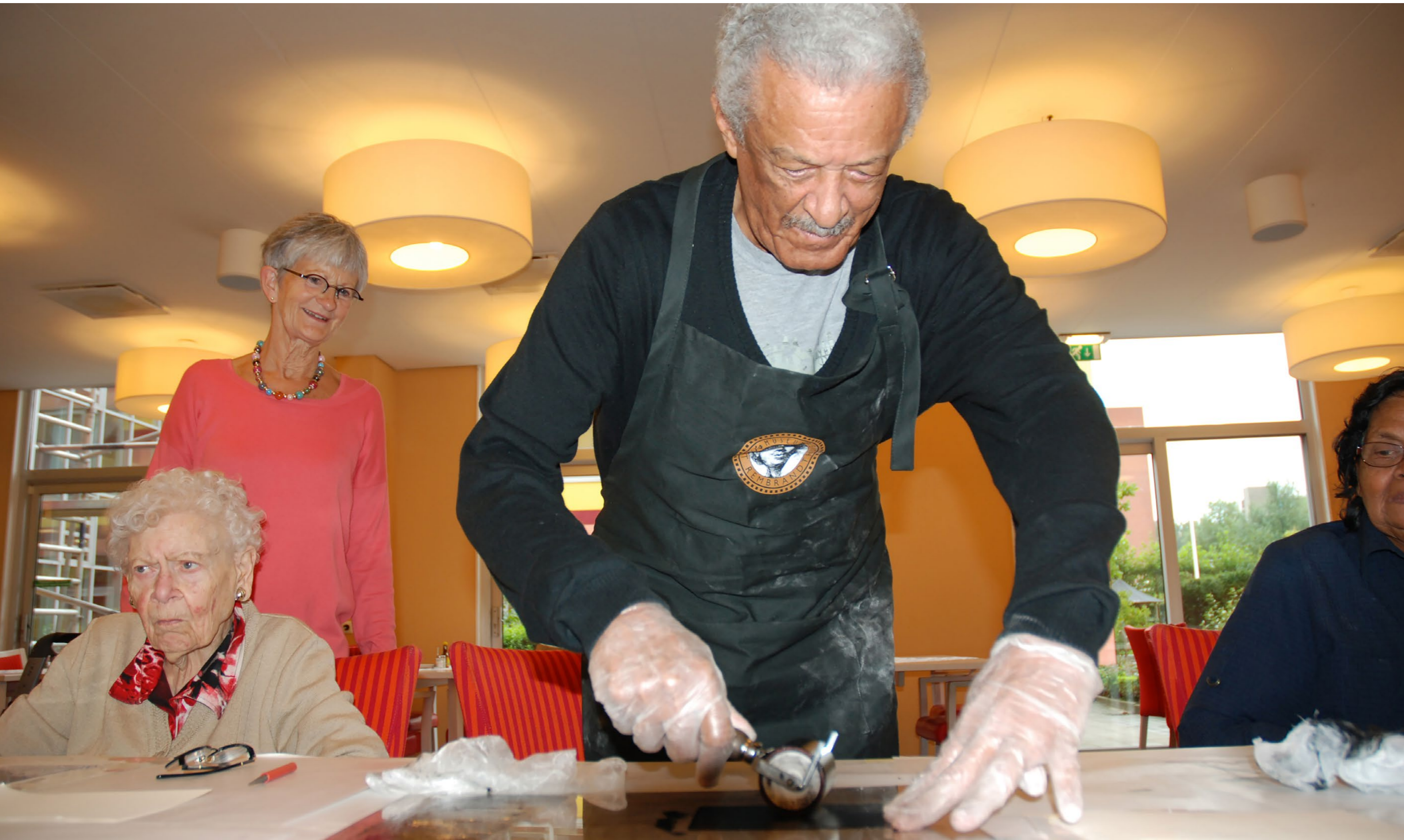
ETSWORKSHOP 'REMBRANDT ONDER DE ARM'