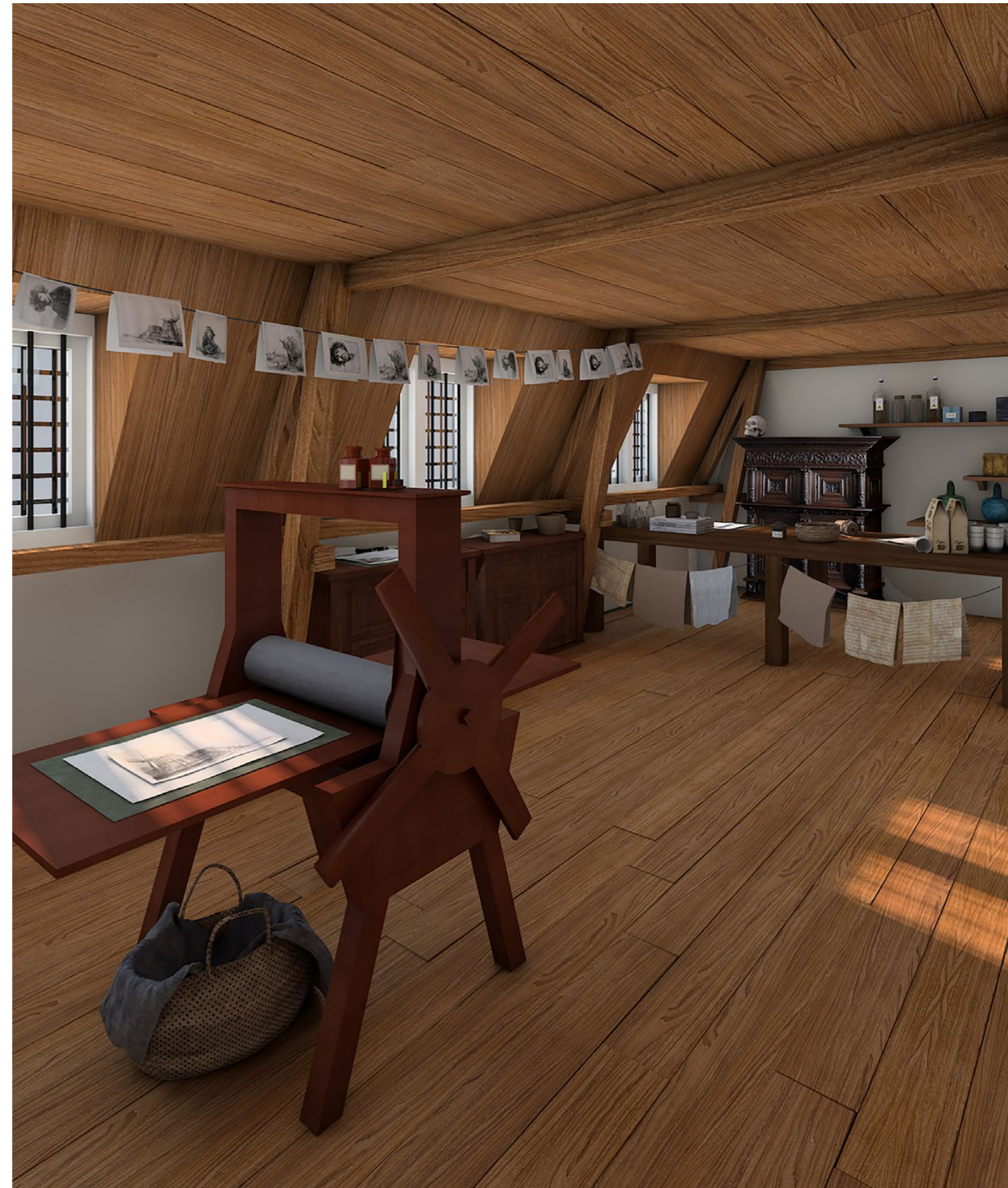
ARTIST IMPRESSION NIEUWE ETSZOLDER DOOR LIES WILLERS

De verbouwing kost ca € 1,8 miljoen en is grotendeels door externe financiers gedekt. Het museum draagt aan de investeringskosten € 235.000 bij uit eigen middelen en dekt de inkomstendering vanwege de sluiting ook uit eigen middelen. Een forse investering voor een klein museum!