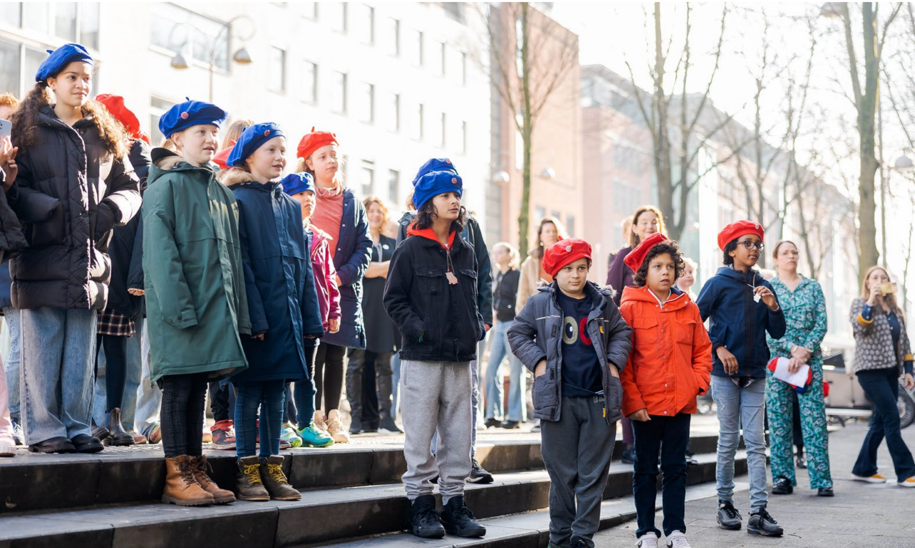
KINDEROPENING VERNIEUWDE MUSEUM.