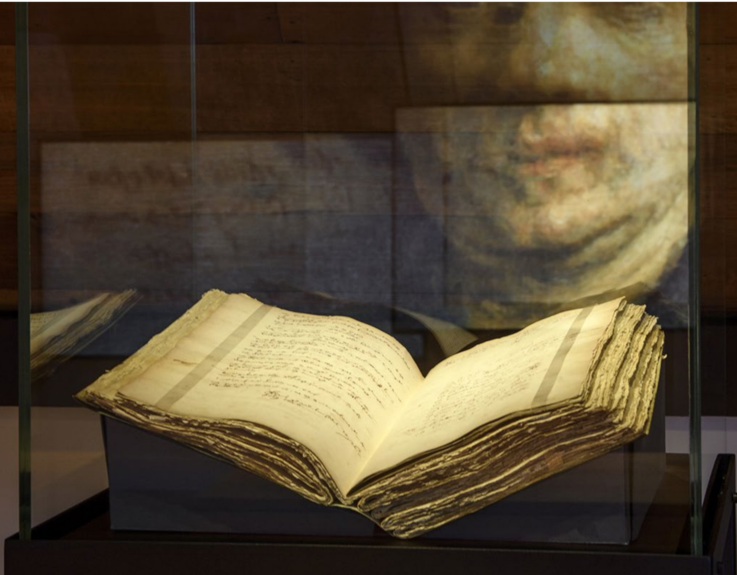
REMBRANDTS BOEDELINVENTARIS.